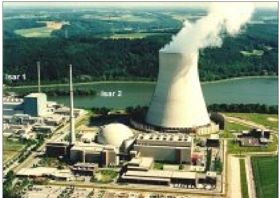
Armanca Komara Îslamî ji xebatên Etomî çêkirin û bidestveanina çekên Etomî ye

Niha Amerîka karî ye 5 welatên senetî yê mezine cîhanê razî bike ku hewl û xebatên dîplomatîk û gotûbêj tevî Komara Îslamî tu encameke erênî